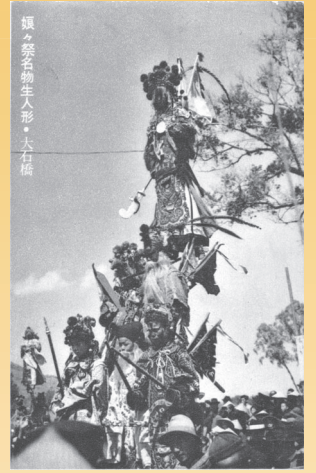
「娘々祭名物生人形・大石橋」 (絵葉書、満洲国期、文理図書館蔵)

今回の展示会では、整理が終わった記録の中から、これまでの展示会で公開されていなかった、日本人が作成した満洲、モンゴル、華北に関する記録を中心に紹介してまいります。個々の記録は、様々な日本人が時々における各地の様子をいわば点描したものとなっていますが、今回その点と点を一堂に展示することで、戦前・戦中期における日本と東北アジア地域の関係実態について考えるきっかけになればと願っています。