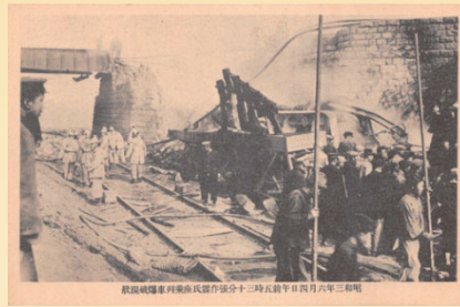
第一公司「張作霖氏坐乗列車爆破現状絵葉書」 (1928年以降、文理図書館蔵)