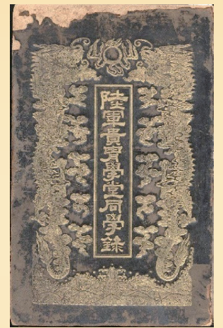
「陸軍貴冑學堂同學録」 (宣統年間刊、文理図書館蔵)