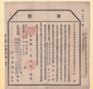
「執照」 (1928年、「大部二郎旧蔵記録」、日大文理資料館蔵)