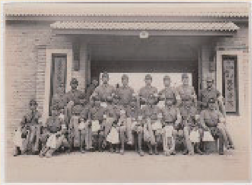
「ノモンハン事件日本軍臨時通訳シテ参加セル學生十九名(一名戦死)」(写真、1939年、「国立興安学院関係記録」、文理図書館蔵)