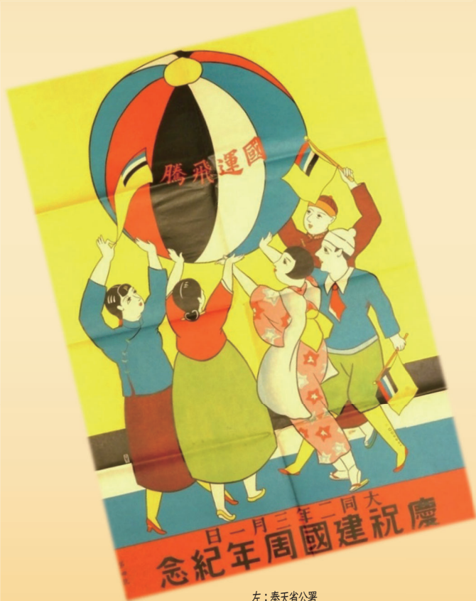
左：奉天省公署 「國運飛騰：大同二年三月一日慶祝建國周年紀念」 (ポスター、1933年、文理図書館蔵) 右：「南滿洲鐵道株式會社」 (カレンダー台紙、1924年用、文理図書館蔵)