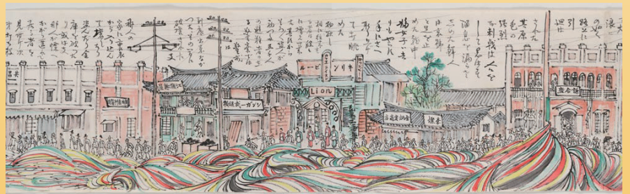
陣内松齡『萬寶山餘波平壤暴動絵巻(部分)』(1931年、文理図書館蔵)

会場：日本大学文理学部資料館展示室（図書館棟1階） 所在地：東京都世田谷区桜上水3-25-40 連絡先：03-5317-8590（資料館事務室直通） 交通案内：京王線 桜上水駅より徒歩8分 京王線・東急世田谷線 下高井戸駅より徒歩8分